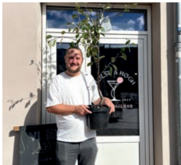
Ved NæverGreen festival havde cocktailbaren Holse & Høgh tilbud på hjemmelavet, økologisk leimon-chello.